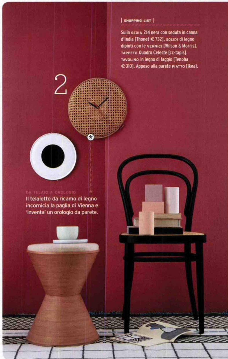
DA TELAIO A OROLOGIO Il telaio da ricamo di legno incornicia la paglia di Vienna e 'inventa' un orologio da parete.

Sulla SEDIA 214 nera con seduta in canna d'India [Thonet € 732], solidi di legno dipinti con le VERNICI [Wilson & Morris]. TAPPETO Quadro Celeste [cc-tapis]. TAVOLINO in legno di faggio [Tenoha € 310]. Appeso alla parete PIATTO [Ikea].